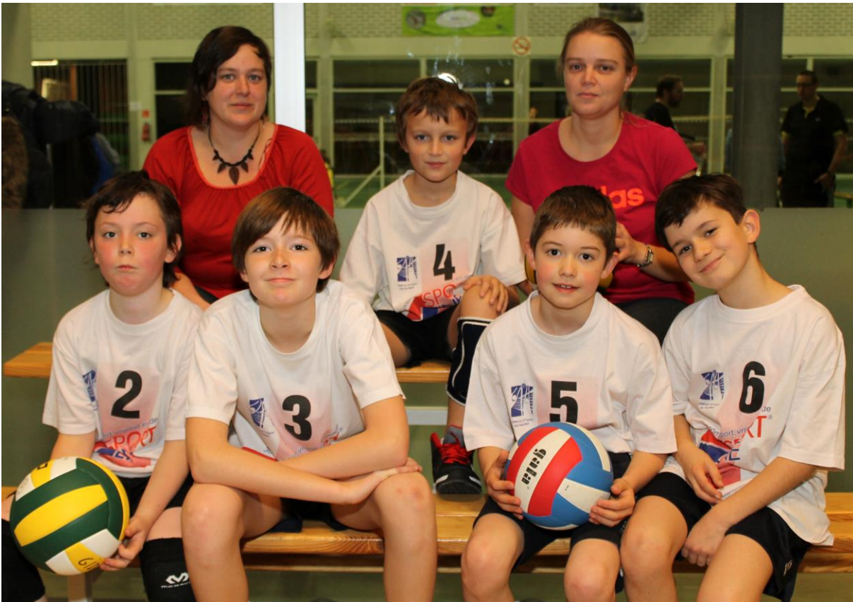
Foto : U13 regionaal jongens