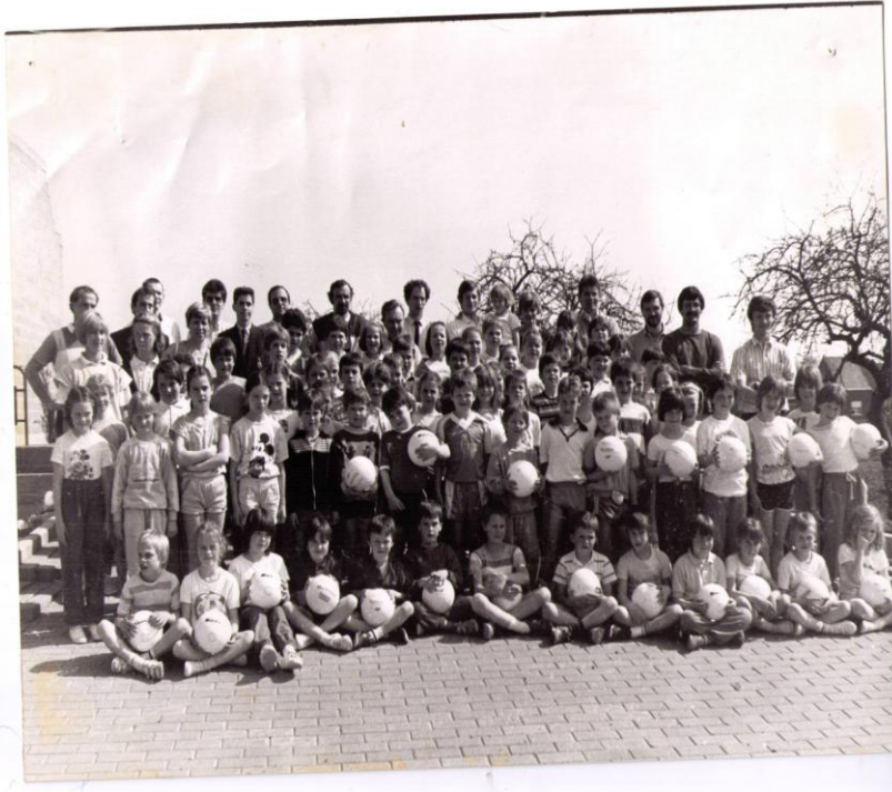
Start jeugdwerking in de jaren 80

Begin jaren 80 werd ook gestart met recreatief volleybal. Lange tijd waren drie ploegen actief in de VLM competitie. Nu is dit teruggevallen naar 2 ploegen, een heren- en een damesploeg.